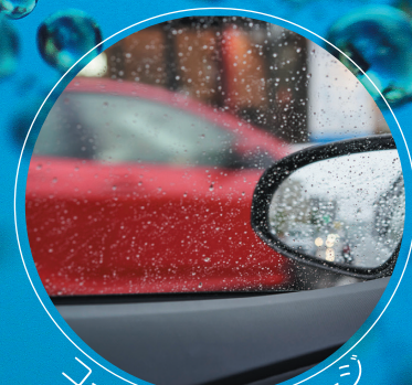
コーティング後イメージ